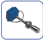
插入式電磁流量計