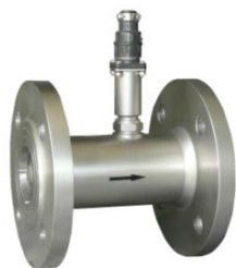
DNTX-A3 / -D2 (法蘭式)

*接續方式最後一碼標示接續方式, (A)表示 ANSI 150# 規格, (J)表示 JIS 10K 規格. 牙接一般標準為 G 牙, PT 及 NPT 牙規可選.