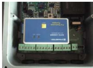
裝於 DTFX-F 固定型