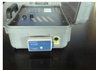
裝於 DTPL-BT 攜帶式熱能表