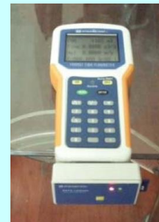
裝於 DTPL-SE 簡易攜帶型